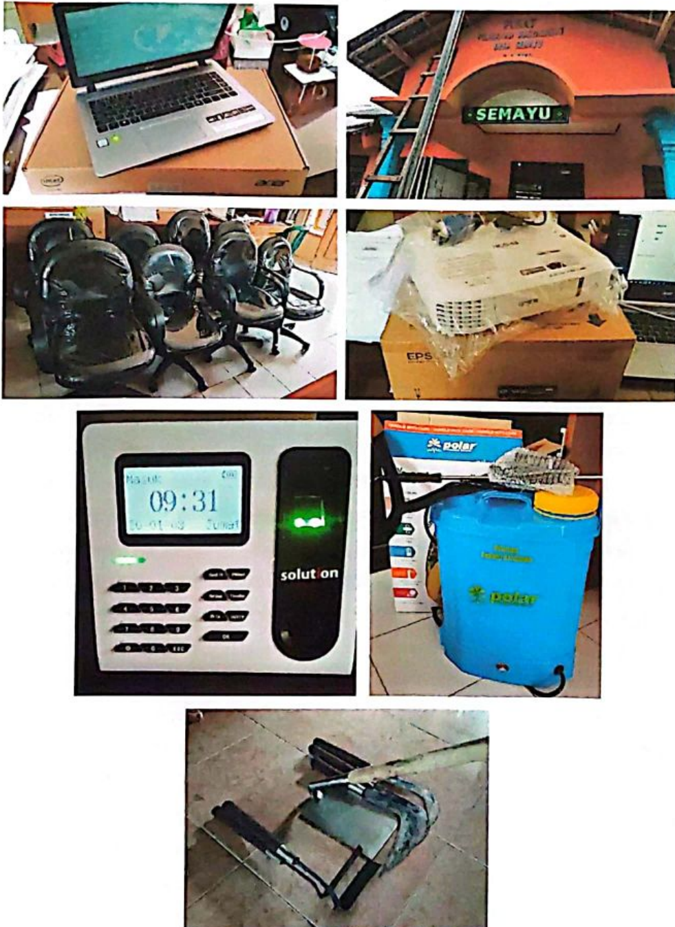
Pengadaan Aset tetap Perkantoran

desa, serta agar pemerintah desa bekerja secara maksimal maka dianggarkan untuk penyediaan sarana (aset tetap) perkantoran yaitu berupa pengadaan laptop, proyektor, finger print, running text, kursi kantor, dan alat kebersihan lingkungan sebesar Rp 24.644.944,- dan terealisasi Rp 23.690.000,- (100%) karena barang telah terbeli semua. Juga agar pelayanan lebih nyaman, maka dianggarkan untuk pemeliharaan gedung dan prasarana Kantor Desa seperti pemeliharaan atap gedung kantor desa, jaringan internet dan pemeliharaan kendaraan dinas dan mobil sampah dengan total anggaran sebesar Rp 11.035.000,- dan terealisasi Rp 10.362.000,- (100%).