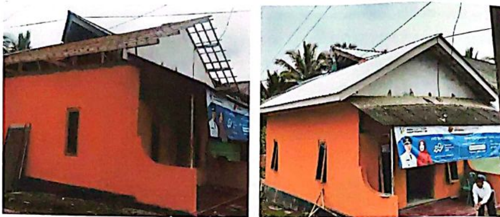
Pemeliharaan Atap Gedung Kantor Desa

Dalam hal pengadministrasian desa juga menganggarkan untuk penyusunan atau pemutakhiran profil desa dengan memberikan honor kepada petugas register desa sebesar Rp 1.800.000,- untuk 1 tahun dan terealisasi Rp 1.800.000,- (100%).